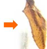
さなぎになって、 何日も何日も眠るのです・・・