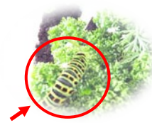
ムシャムシャよく食べる はらぺこあおむし