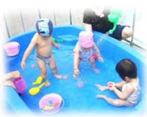
小さいお友達は浅いプールでバシャバシャ大喜び♡

初めて“プール”に入るお友達も多く、最初は不安で入りたがらない様でしたが、徐々に慣れ、水の中のおもちゃを拾ったり、滑り台を滑って楽しんでいましたよ！