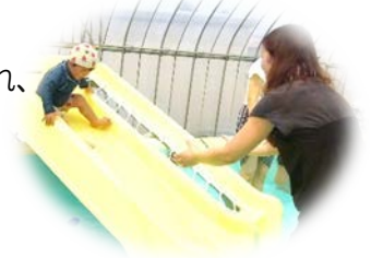
最初は怖がっていましたがすっかり楽しくなり何度も何度も滑っていましたよ！