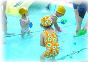
大きいプールではおもちゃの貝がら拾い！