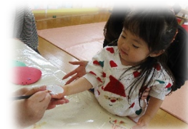
手形を取って 雪だるまに したよ😊