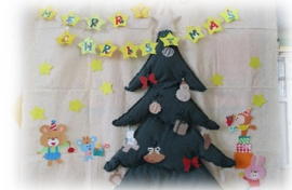
写真をたくさん撮って くれてありがとう♥

12月23日(月)・24日(火)の二日間で クリスマス会をしました！製作をしたり、ミニゲームや ハンドベルをして大盛り上がりでした🎄 サンタさんの格好で遊びに来てくれたお友達もいて、 とってもかわいい姿を見せてくれました♥ 最後にサンタさんがプレゼントを持って遊びに 来てくれましたよ🎁 プレゼントはお家でもたくさん遊んでくださいね😊