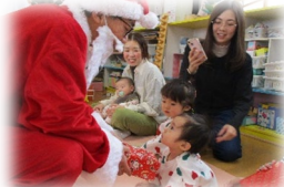
サンタさんに会えたね♥

12月23日(月)・24日(火)の二日間で クリスマス会をしました！製作をしたり、ミニゲームや ハンドベルをして大盛り上がりでした🎄 サンタさんの格好で遊びに来てくれたお友達もいて、 とってもかわいい姿を見せてくれました♥ 最後にサンタさんがプレゼントを持って遊びに 来てくれましたよ🎁 プレゼントはお家でもたくさん遊んでくださいね😊